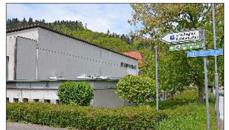
Die Stadhallen-Sanierung soll jetzt Anfang März mit Hochdruck beginnen.