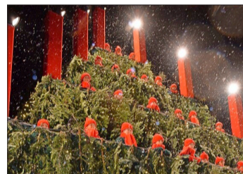
Der Stadtfest-Verein ist bereits mit Planung des Singenden Weihnachtsbaum beschäftigt.

Waldkirch (hbl). Der erste „Singen-de Weihnachtsbaum“ Dezember 2022 war ein überwältigender Erfolg. Dank der riesigen Resonanz plant der Stadtfestverein eine Neuauflage vom 8. bis 17. Dezember.